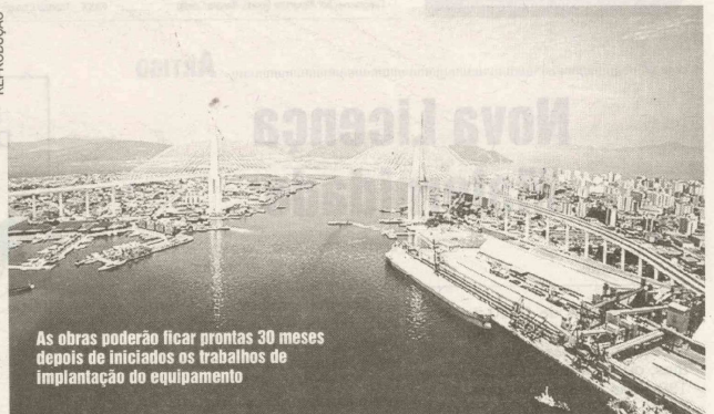
As obras poderão ficar prontas 30 meses depois de iniciados os trabalhos de implantação do equipamento

uma grande obra rodoviária que acabaria por não satisfazer as necessidades de quem usa o sistema (de balsas)".