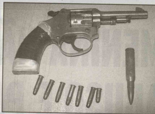
Foram apreendidos um revólver calibre 22 e munições